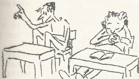
חלקי בתכנית :

ישנם תחומים רבים המעניינים את החברים (ותיקים כצעירים) ושאינם אפשרות ללומדם, מתוך מגבלות אובייקטיביות כגון נסיעות, זמן וכ"ו. הסדר של חוגים בבית היה יכול לענות על חלק של הרצונות ההלה.